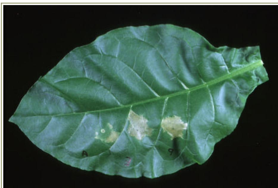
Figura 1. Respuesta hipersensible en una hoja de tabaco infectada con la bacteria Agrobacterium vitis .

Además de estas respuestas inducidas por bacterias, las plantas suelen almacenar en las vacuolas de las células, de manera independiente de la presencia del patógeno, compuestos con actividad antimicrobiana como saponinas y glucosinolatos. En añadidura a las respuestas defensivas localizadas en el sitio de la infección, numerosos patógenos son capaces de activar, en el término de horas, la inducción de respuestas defensivas similares en otros órganos de la planta que pueden estar a considerable distancia. Al tener las defensas activadas, estos órganos todavía no infectados se vuelven mucho más resistentes a los patógenos. Este fenómeno se conoce como resistencia sistémica adquirida o SAR, por sus siglas en inglés ( systemic acquired resistance ). Aunque el mecanismo de transmisión de la señal a través de la planta no está completamente elucidado, se sabe que la hormona ácido salicílico participa de él.