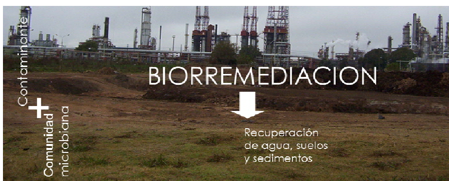
Figura 1: Imagen conceptual de la Biorremediación

La biorremediación, la explotación de las capacidades metabólicas de los microorganismos para degradar contaminantes, tiene hoy en día gran aceptación como una estrategia efectiva, costo-competitiva y ambientalmente amigable para la recuperación de aguas, suelos y sedimentos contaminados [1,2] (Fig. 1). Los microorganismos, y en especial las bacterias, son reconocidos por su amplia capacidad catabólica y su actividad en los procesos de biorremediación, sin embargo la falta de información sobre los factores que controlan el crecimiento y la actividad de los microorganismos en los ambientes contaminados hace que, aún en la actualidad, los procesos de biorremediación tengan resultados impredecibles y que la comunidad microbiana responsable del proceso sea considerada como una “caja negra” [3]. Idealmente, las estrategias de biorremediación deberían ser diseñadas en base al conocimiento de los microorganismos presentes en los ambientes contaminados, sus capacidades metabólicas, y la respuesta a los cambios en las condiciones ambientales [4].